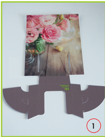
Prospekthalter / Flyerständer.