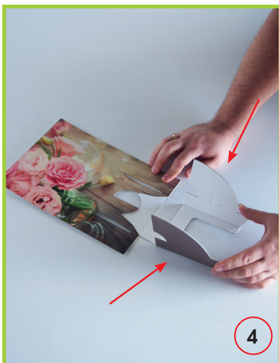
Seitliche Flügel aufrichten.