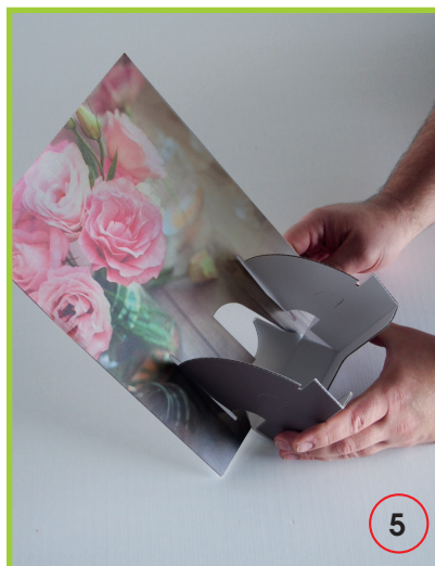
Flügel durch Schlitz stecken.