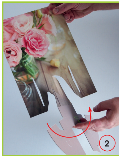
Dispenserfach um 180° drehen.